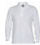
5008 CARPE NIÑO Página 58